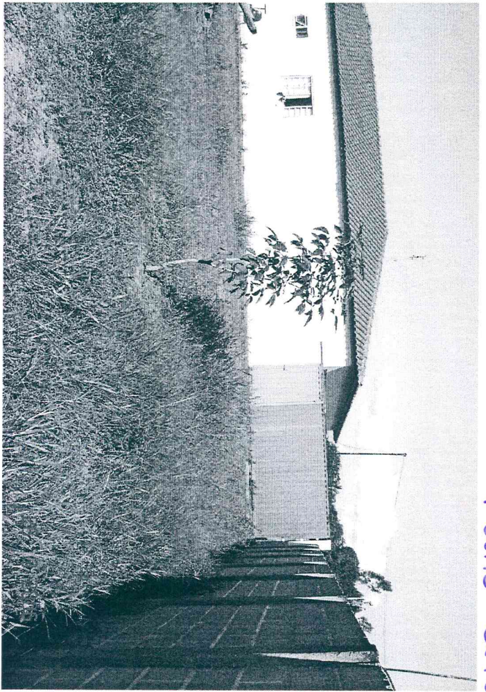
Patio externo da Creche Municipal de Camar